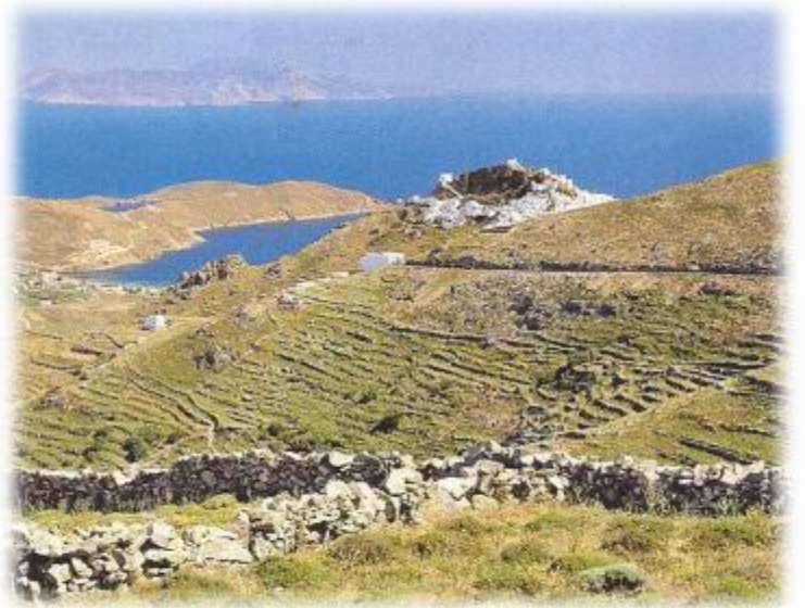
Végétation sèche dans les îles Cyclades (Grèce)