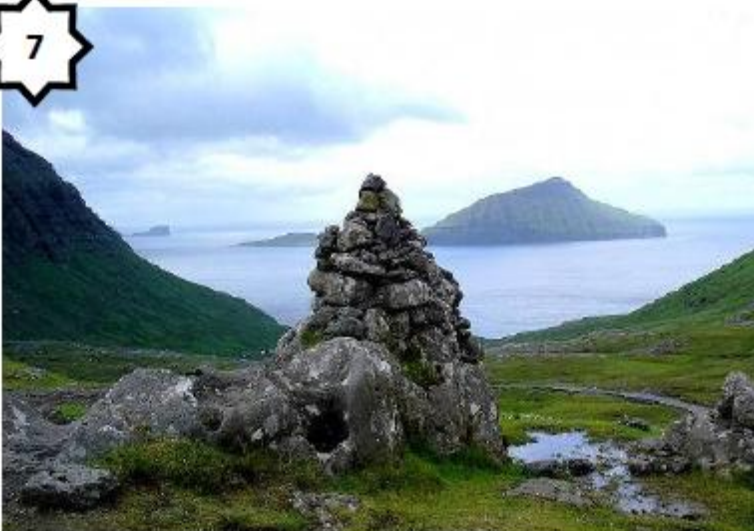
Paysage de littoral (Iles Féroé - Danemark)