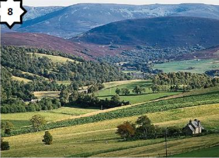
Paysage de montagnes (Highlands - Ecosse)