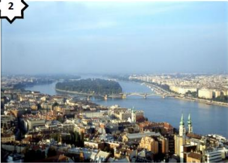
Paysage fluvial (Danube – Hongrie)