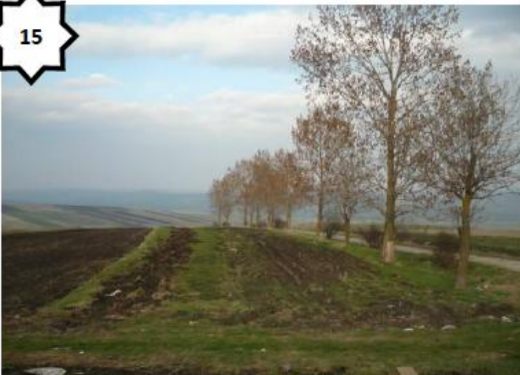
Paysage de plaine (Transylvanie - Roumanie)