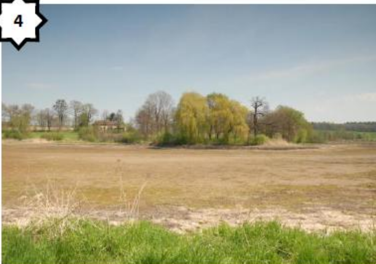
Paysage de plaine (Lazy - Pologne)