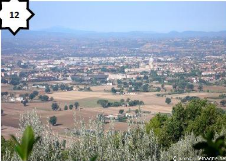
Paysage de plaine (Assise - Italie)