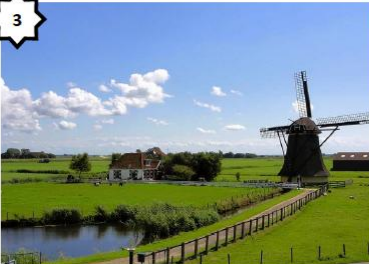
Paysage de plaine (Pays Bas)