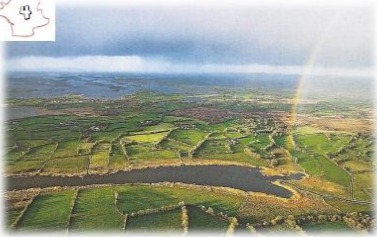
La campagne irlandaise