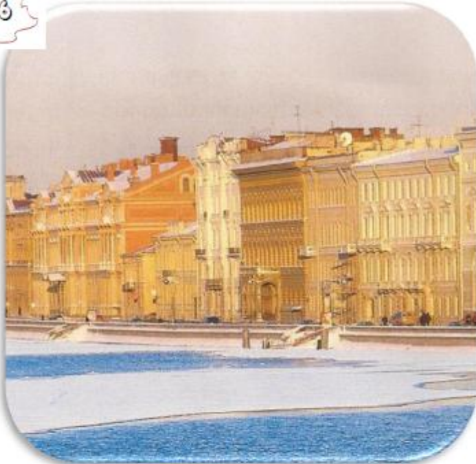
La rivière Neva à St Pétersbourg (Russie)