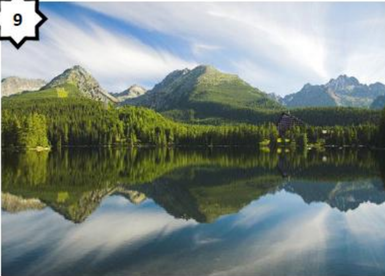
Paysage de montagnes (Tatras - Slovaquie)