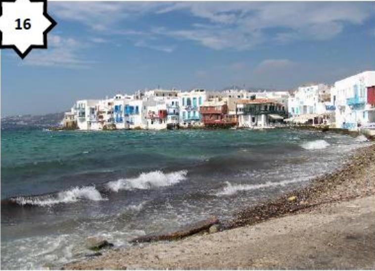
Paysage de littoral (Mykonos - Grèce)