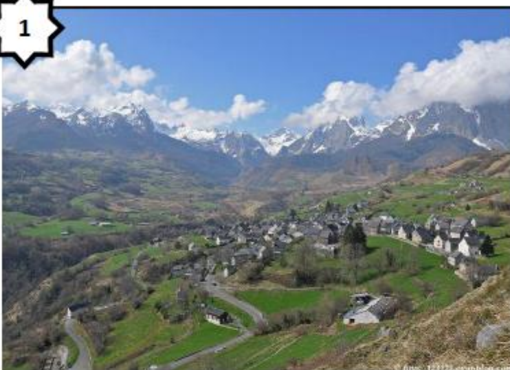
Paysage de montagnes (Pyrénées - Espagne)