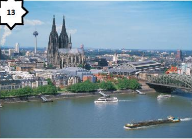
Paysage fluvial (Rhin - Allemagne)