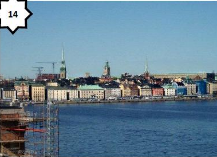
Paysage de littoral (Suède)