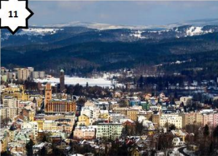
Paysage de montagnes (Bohème- Rép. Tchèque)