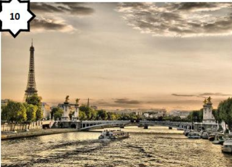
Paysage fluvial (Seine – France)