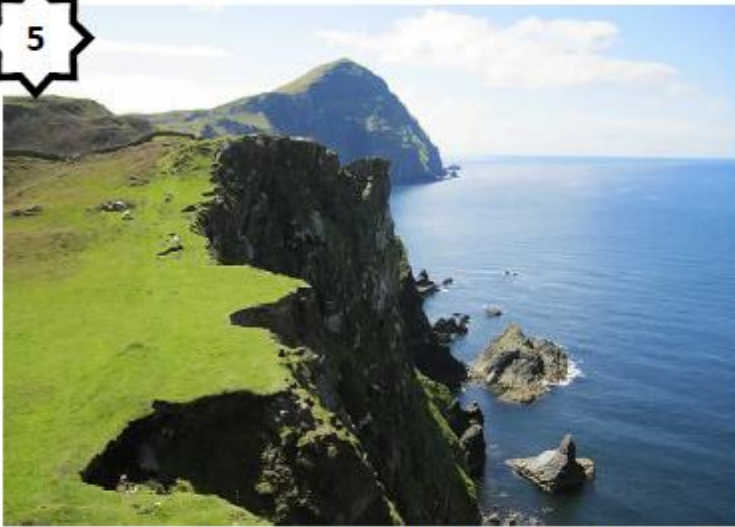
Paysage de littoral (Aran - Irlande)