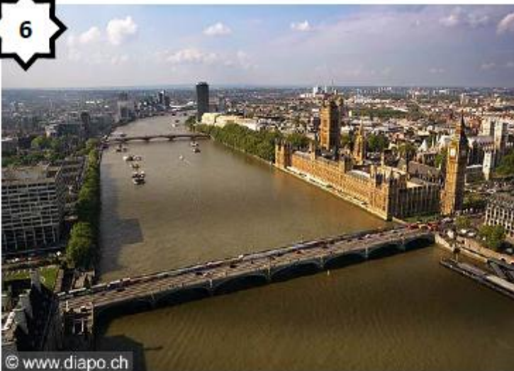
Paysage fluvial (Tamise - Angleterre)